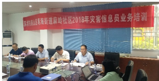
南山区粤海街道麻岭社区