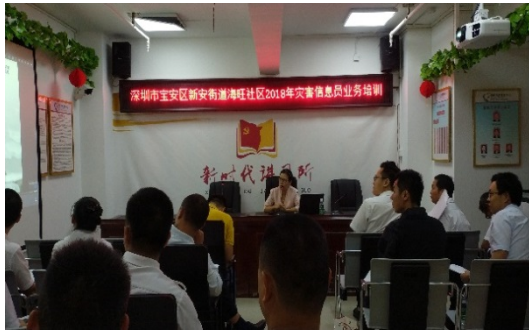
宝安区新安街道海旺社区