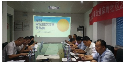
图 2 2018 年部分社区灾害信息员业务培训

灾害制度建设与研究。 2018 年，承保机构配合市民政局、深圳市社会工作者协会制定了“深圳市自然灾害室内应急避难场所（市救助管理站）规范化建设设计项目书”。项目通过邀请标准化专家、空间设计师和室内应急避难场所的社工共同参与，旨在有效提升与深化现有防灾减灾管理工作，将政府支持、公益服务、企业及社会大众参与相结合，建设具有人情味、合理、高效的社会应急环境。此外，承保机构自行组织或委托第三方对深圳市气象灾害、巨灾保险发展方向进行研究，并出具《深圳市构建巨灾保险基金可行性研究》、《深圳市气象灾害类巨灾风险评估报告》等研究成果。