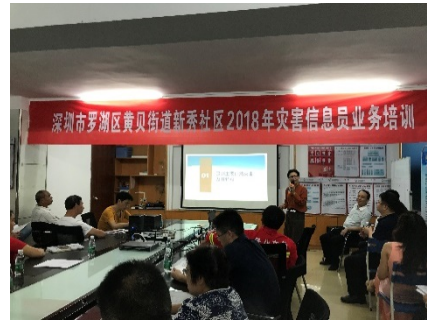
罗湖区黄贝街道新秀社区