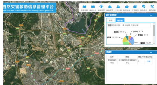
物资储备模块信息